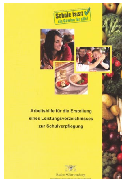
Abb. 1 ▲ Titelblatt der „Arbeitshilfe zur Erstellung eines Leistungsverzeichnisses“ [6]

Scholl u. Kutsch [12] zeigten in einer Fallstudie an einer Bonner Grundschule, dass die Essatmosphäre durch das Zusammenwirken von sensorischen Faktoren – Geruch, Geschmack, Temperatur und Optik der angebotenen Speisen – und einer Vielzahl von Umweltfaktoren bestimmt wird. Dazu zählen das Ambiente in der Mensa, also Geräusche, Gerüche, Raumtemperatur, Lichtverhältnisse und farbliche Gestaltung der Räumlichkeiten sowie Gestaltungsmöglichkeiten durch die Schüler, aber auch die zeitlichen Gegebenheiten beim Verzehr der angebotenen Mahlzeit. Weiterhin spielen soziale Faktoren eine Rolle, die mit Anwesenheit und Verhalten anderer Personen zusammenhängen.